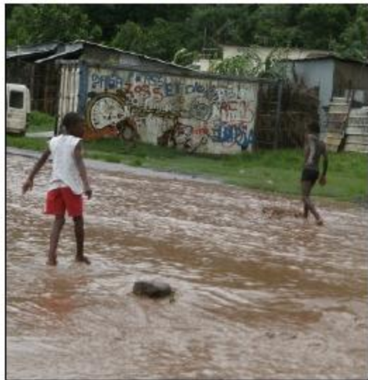
Enfants jouant dans les rues sous la pluie!

Les déchets, les excréments d'animaux ainsi que la présence de rats contaminent ces eaux stagnantes. Les bactéries se développent et touchent les personnes qui marchent ou jouent dedans.