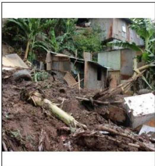
Coulée de boue emportant tout sur son passage

Lorsque la pluie s'arrête, des flaques et des réserves d'eau se forment.