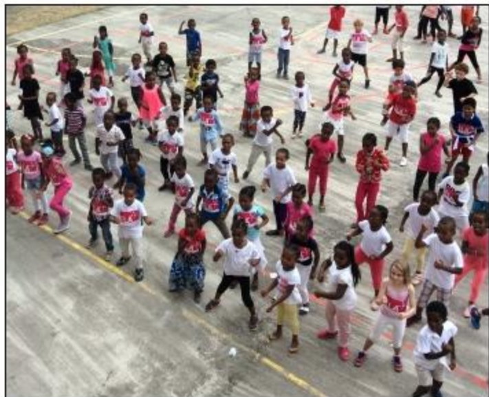
Mets tes baskets et danse la zumba à Pamandzi 4.